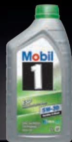
Mobil 1™ ESP 5W-30