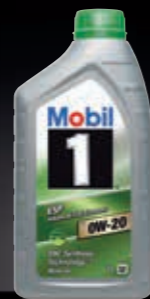
Mobil 1™ ESP x2 0W-20