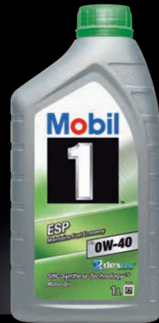
Mobil 1™ ESP x3 0W-40 Der erste Schmierstoff mit Porsche C40 Freigabe!