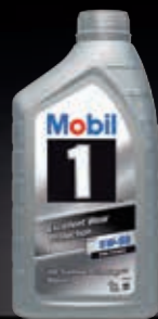
Mobil 1™ FS x1 5W-50