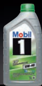
Mobil 1™ ESP x3 0W-40