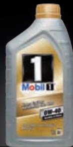
Mobil 1™ FS 0W-40