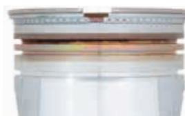
Mobil Pegasus™ 1105