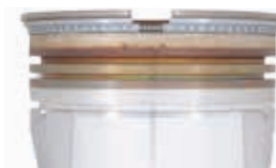
Mobil Pegasus™ 1107

Beide Mobil Pegasus™ 1100-Öle stellen wir aus einem optimierten Grundöl und ausgewogenen Additiven her.