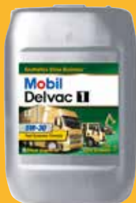
Mobil Delvac 1™ LE 5W-30

*Empfohlen von ExxonMobil für Anwendungen