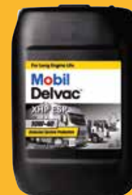
Mobil Delvac™ XHP ESP 10W-40